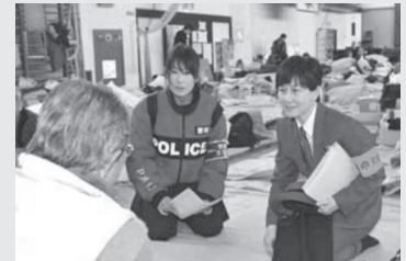
被災された方のお話をうかがう女性警察官

女性や子育て中の方など、男性には相談しづらいことであっても、お話をうかがいます。みなさまから寄せられた要望を、関係機関などに伝達し、女性やお子さまに配慮した避難所運営がなされるためのお手伝いをさせていただきます。