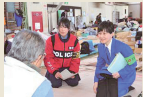
被災された方のお話をうかがう女性警察官