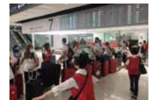
Instructions communiquées via les playbooks et contrôles sanitaires stricts