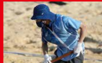
Mise à disposition de gilets rafraîchissants pour le personnel employé sur le site des Jeux