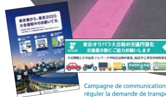
Campagne de communication pour réguler la demande de transport

Afin de garantir le bon déroulement des Jeux de Tokyo2020 et d'assurer la sécurité pendant la compétition, diverses mesures ont été prises en matière de prévention des catastrophes, pour renforcer la sécurité et pour faciliter les déplacements. En plus du renforcement des capacités aéroportuaires et de l'aménagement des routes et autres infrastructures, un ensemble de dispositions visant à réduire le trafic a été mis en place, notamment en encourageant le télétravail. Un système informatisé d'assistance à la régulation du trafic routier a également été introduit afin d'assurer le bon déroulement du transport des athlètes et des officiels des Jeux. Toutes ces mesures jettent les bases d'un grand chantier de modernisation des fonctions urbaines.