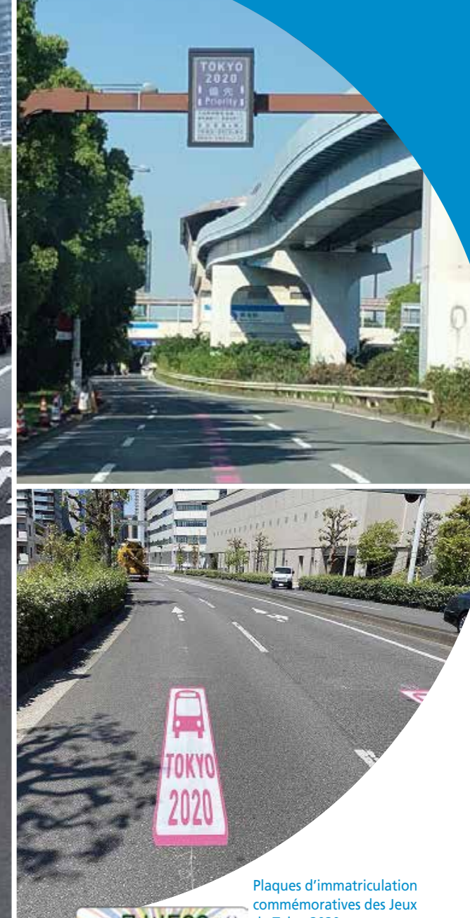
Plaques d'immatriculation commémoratives des Jeux de Tokyo2020