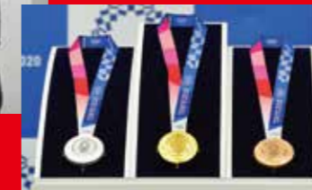
Environ 5 000 médailles fabriquées à partir de métaux recyclés