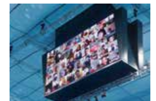
Supporters encourageant leurs champions à distance grâce à la 5G