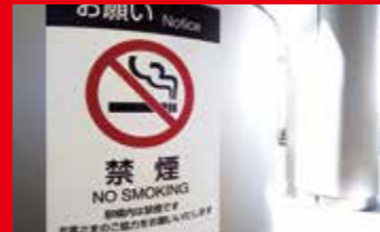
Mesures contre le tabagisme passif