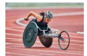
Technologies d'allègement des fauteuils roulants