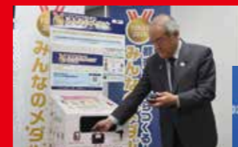
L'ensemble des citoyens a pu contribuer à la production des médailles grâce au programme de recyclage

Afin de faire évoluer les mentalités et les modes de vie selon les principes du développement durable, nous avons fait la part belle aux métaux et aux plastiques recyclés et mis à profit l'énergie hydrogène pendant les Jeux.