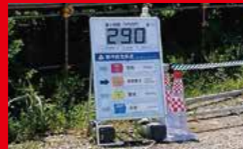
Panneaux d'affichage de l'indice WBGT Diffusion d'informations sur l'indice de chaleur WBGT