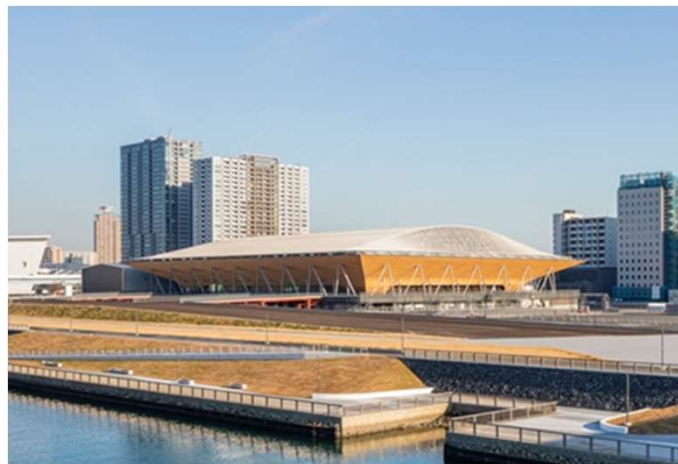
2019年10月竣工時 北西側から撮影（外観）