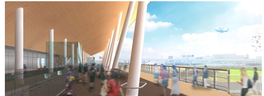
国産木材を使用した外装