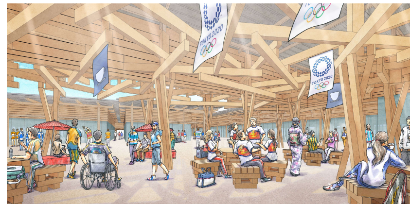
内観イメージ（2018年10月時点）