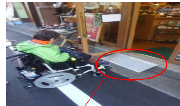
店舗への取り外し可能な簡易スロープの設置