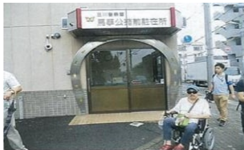
障害者と共にユニバーサルデザインの視点でまち歩き