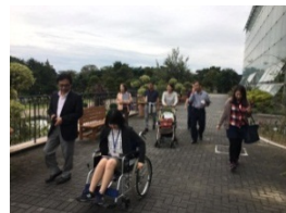
UDツーリズムの検証