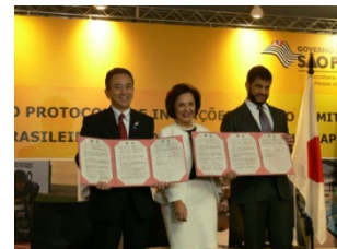
ブラジルパラリンピック委員会との覚書締結