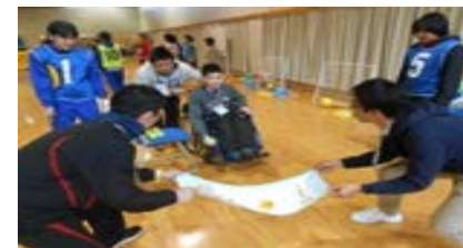
障害者スポーツの体験