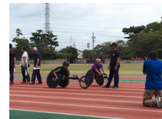
パラリンピアンとのふれあい