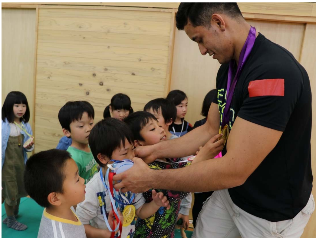
(広島県廿日市市で柔道メキシコチーム受入れ 2018年4月)