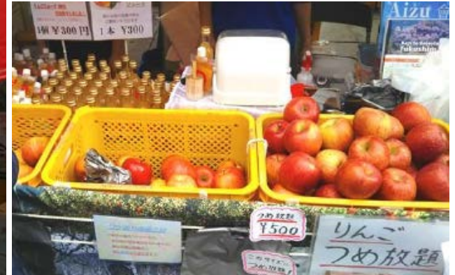
岩手県、宮城県、福島県がそれぞれの特産物を販売。遠野林檎シールド、気仙沼ふかひれスープ、福島県のりんごつめ放題などが大人気！