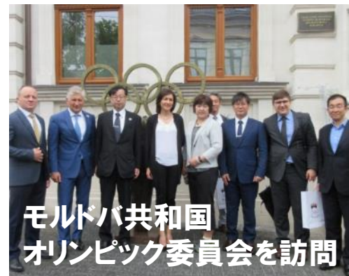
モルドバ共和国 オリンピック委員会を訪問