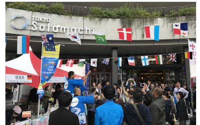
茨城県常陸大宮市、宮城県蔵王町、在日パオ共和国大使館が合同で出展。テレビ局の取材を受けた。