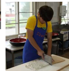
茶道、弓道、 そば打ち体験 の様様