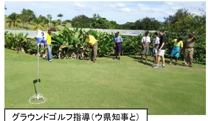
グラウンドゴルフ指導（ウ県知事と）