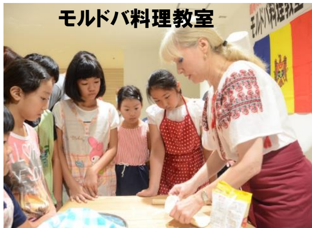
モルドバ料理教室