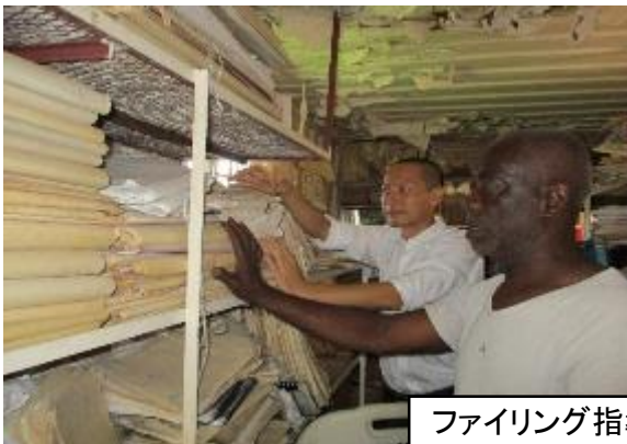
ファイリング指導（ウエストモアランド県庁）