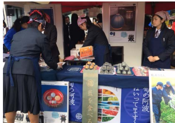
徳島県のブースは、ドイツチーム受入時の写真を展示した他、徳島商業高校、城西高校の生徒たちが、徳島特産の阿波藍を使った商品など自分たちの開発した商品を販売。