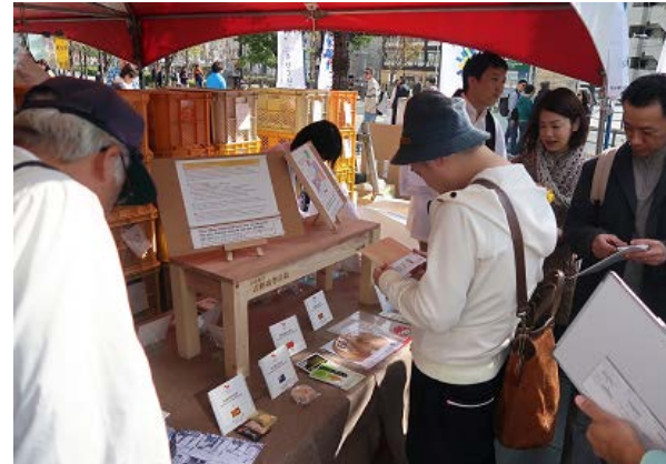
内閣官房東京オリンピック・パラリンピック推進本部事務局も出展し、全国各地のホストタウン自治体の紹介を実施。