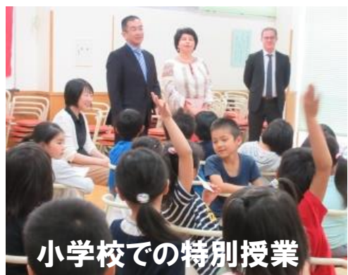
小学校での特別授業