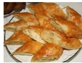
ブラチンタ(モルドバ風パイ)