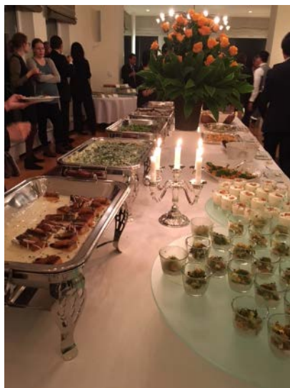
大使主催レセプション。公邸料理人が腕によりをかけたドイツ料理・ヨーロッパ料理が並んだ。