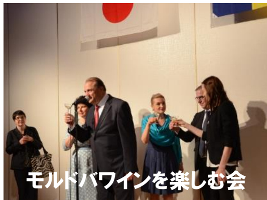
モルドバワインを楽しむ会