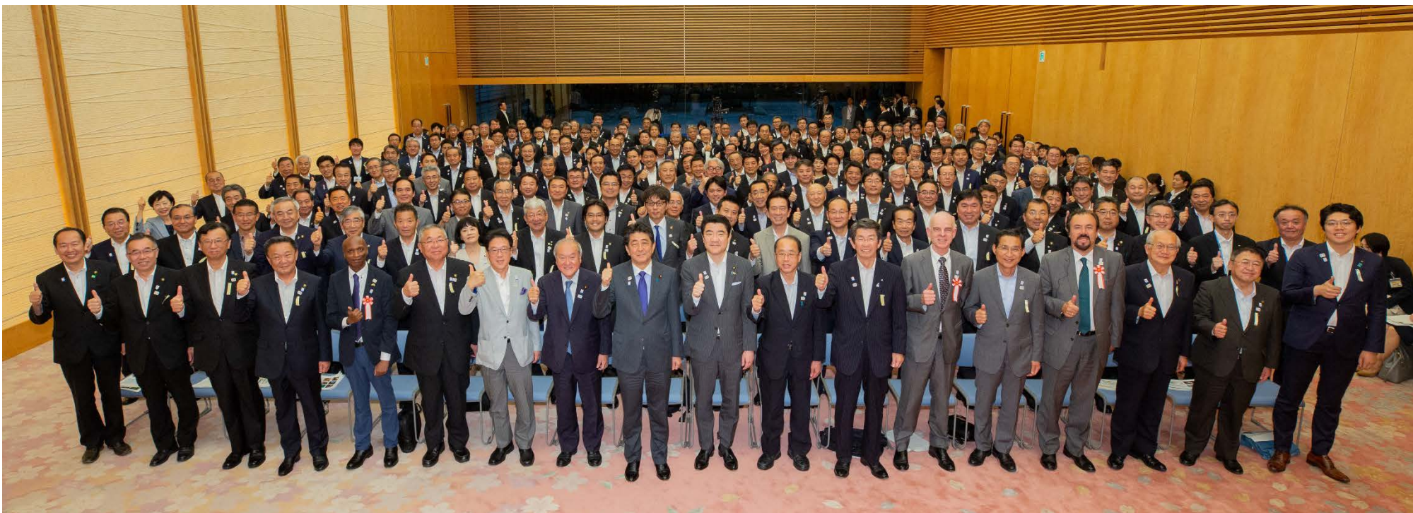
(「ホストタウン首長会議」 2019年6月)