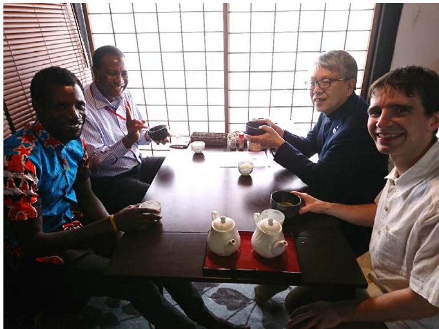
(宮崎県日向市とトーゴの交流 2019年3月)