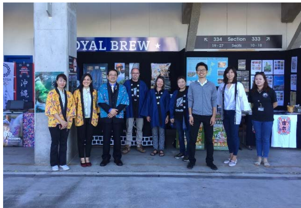
(ニュージーランド "Japan Day" でのホストタウン共同出展 2019年3月)