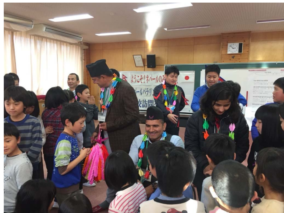
(福島県田村市でネパールパラ陸上チームの受け入れ 2018年12月)