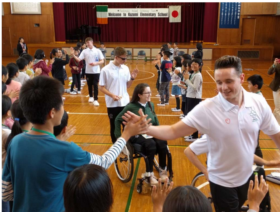
(千葉県成田市でアイルランドパラ水泳チームの受け入れ 2018年11月)