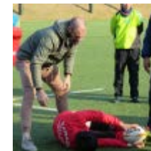
2018.3 岩手県釜石市に震災時にお世話になった豪州ラグビー選手が訪問