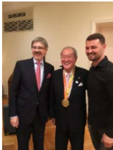
大使主催レセプション。左からフォンヴェアテル大使、鈴木オリパラ担当大臣、ハインリヒ・ポポフ選手

【参加自治体】 山形県鶴岡市、東根市、群馬県沼田市、東京都文京区、東京都青梅市、新潟県上越市、山梨県山梨市、愛知県豊橋市、岡山県真庭市、徳島県・那賀町、福岡県田川市、宮崎県・宮崎市・延岡市・小林市