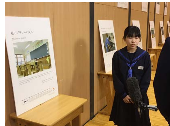
NHK新番組サンデースポーツ2020（4月8日放送）でホストタウンを特集