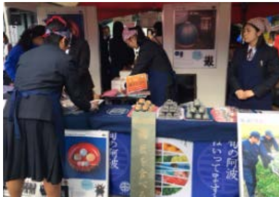
徳島県のブースは、ドイツチーム受入時の写真を展示した他、徳島商業高校、城西高校の生徒たちが、徳島特産の阿波藍を使った商品など自分たちの開発した商品を販売。