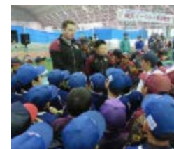
2018.2 岩手県花巻市で米国人元野球選手が野球教室を実施