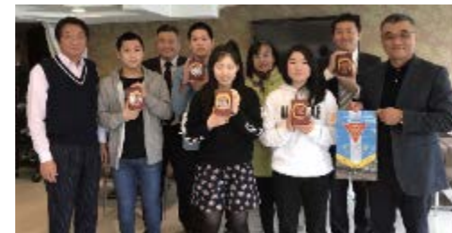
2018.1 岩手県野田村の中学生が台湾ロータリークラブに感謝の気持ちを伝える。