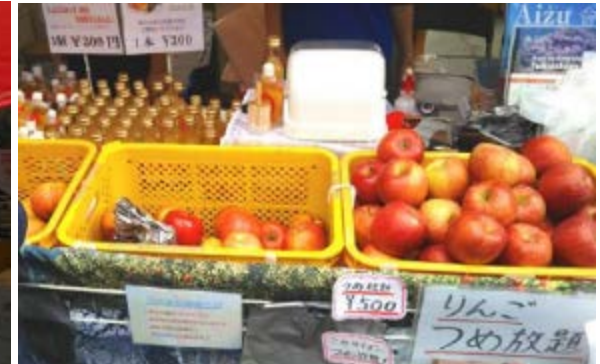
岩手県、宮城県、福島県がそれぞれの特産物を販売。遠野林檎シードル、気仙沼ふかひれスープ、福島県のりんごつめ放題などが大人気！