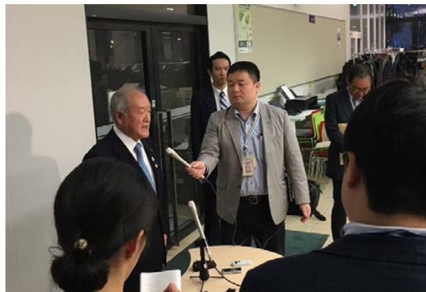
「ホストタウンサミット」での囲み取材