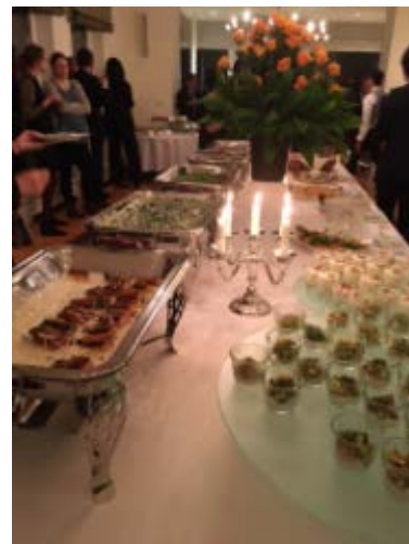
大使主催レセプション。公邸料理人が腕によりをかけたドイツ料理・ヨーロッパ料理が並んだ。