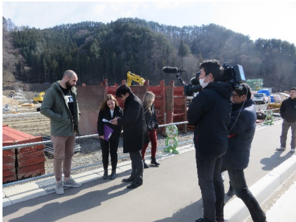
復興ありがとうホストタウン（釜石市）でのイベントでもカメラが密着！