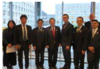
2018.1 宮城県東松島市長が支援してくれたデンマーク企業を訪問