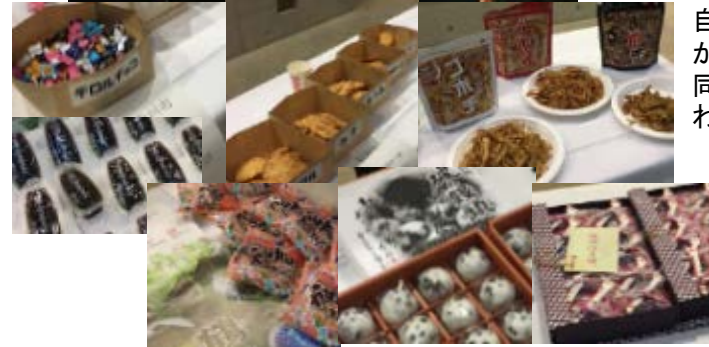
ミーティング中のコーヒーブレイクでは、各自治体自慢のお菓子をつまみながらホストタウン自治体同士の交流が活発に行われた。