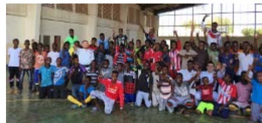
2018.2 ジブチに福島県南相馬市の空手指導者が訪問。