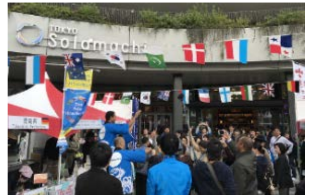
茨城県常陸大宮市、宮城県蔵王町、在日パオ共和国大使館が合同で出展。テレビ局の取材を受けた。