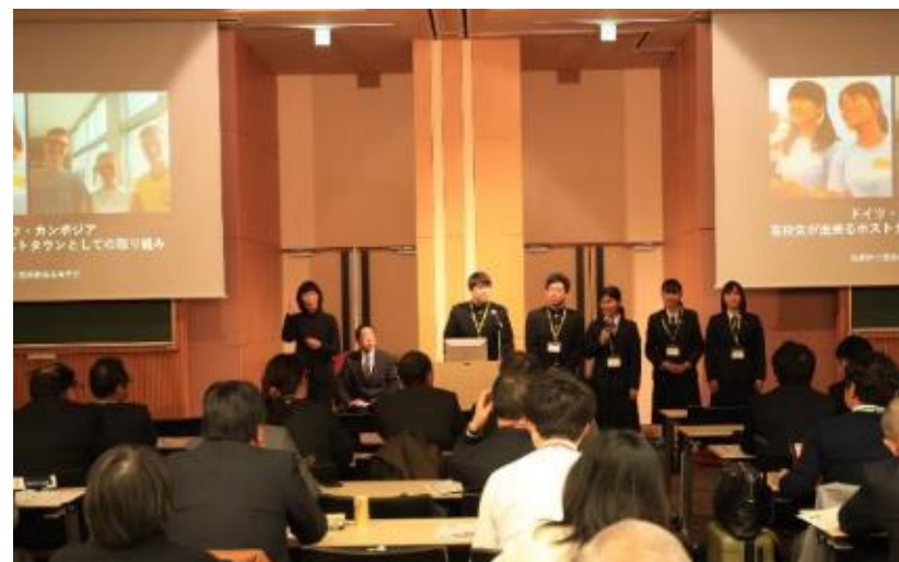
ホストタウンサミットで発表する徳島商業高校の生徒