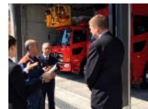
2018.3 岩手県大船渡市に震災時に救助活動をしてくれた米国救援隊員が訪問。