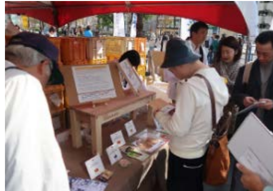
内閣官房東京オリンピック・パラリンピック推進本部事務局も出展し、全国各地のホストタウン自治体の紹介を実施。