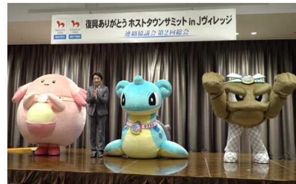
ポケモン（ラッキー、ラプラス、イシツブテ）を「復興ありがとうホストタウン大使」に任命。