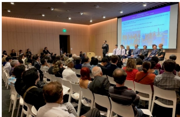
米国ロサンゼルスでのPRイベント