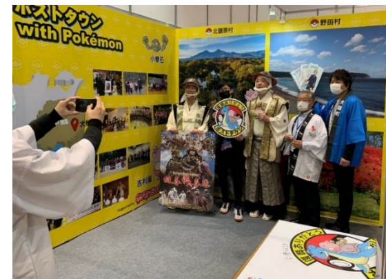
台湾でのイベントへの出展