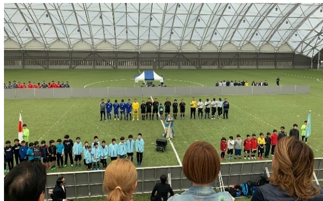
復興ありがとうホストタウンサミット (ブラインドサッカー日本代表vsアルゼンチン代表親善試合)