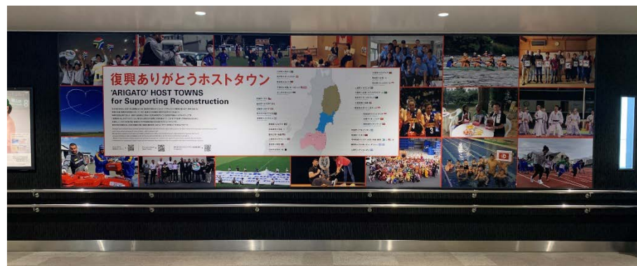
③ポスタースペース