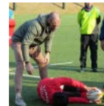
2018.3 岩手県釜石市に震災時にお世話になった豪州ラグビー選手が訪問