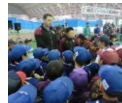
2018.2 岩手県花巻市で米国人元野球選手が野球教室を実施