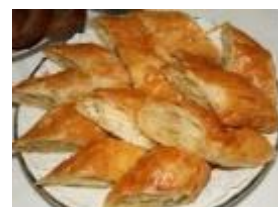
ブラチンタ(モルドバ風パイ)