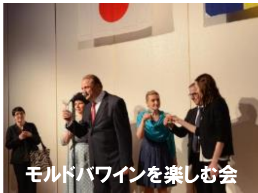
モルドバワインを楽しむ会