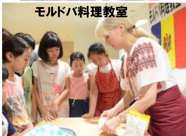
モルドバ料理教室