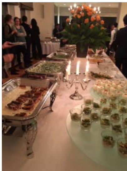
大使主催レセプション。公邸料理人が腕によりをかけたドイツ料理・ヨーロッパ料理が並んだ。