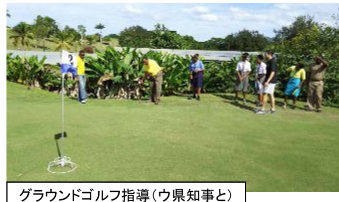
グラウンドゴルフ指導（ウ県知事と）