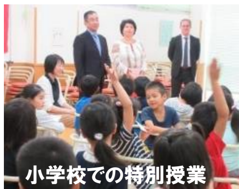
小学校での特別授業