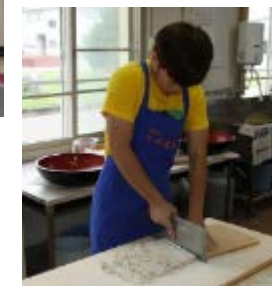
茶道、弓道、 そば打ち体験 の様様