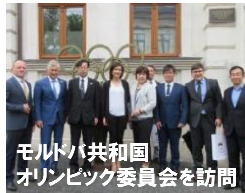
モルドバ共和国 オリンピック委員会を訪問