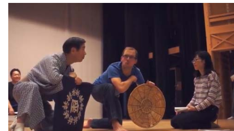
Ekin Kabuki Festival, Akaoka, Japan

→ 日本の強みである地域性豊かで多様性に富んだ文化を活かし、外国人の視点に基づいた日本の魅力を発信すべく、平成29年度以降も継続して実施