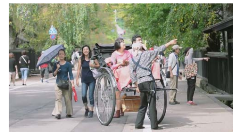
THIS IS JAPAN