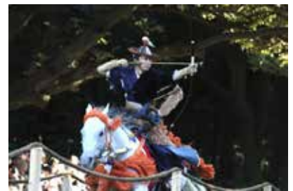
2016年11月3日 明治神宮 流鏝馬神事(奉射)

寒川神社、明治神宮の流鏝馬神事/上賀茂神社の笠懸神事に関して英語情報等を付加したコンテンツを団体 Web サイトに掲載、場内の英語アナウンス・解説、射手と外国人のミニ交流セッション等を実施することで、流鏝馬への国内外の理解を促す。