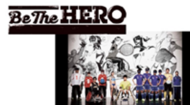
平成27年度障害者スポーツ普及啓発映像 Be The HERO (東京都オリンピック・パラリンピック準備局スポーツ推進部障害者スポーツ課)

日本を代表する漫画家やマンガを学ぶ学生による障がい者スポーツ・マンガの創作を通じて、障がい者スポーツの魅力を発信。雑誌連載や出版を広げる端緒とし、漫画コンテンツの魅力と共生社会に向けた取組の輪を広げる。