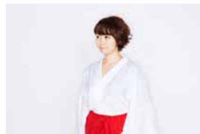
市原えつこ

実施団体: 株式会社 電通国際情報サービス 予定事業名: メディアアートによる日本の祭りの魅力再発見プロジェクト (仮) 実施時期: 2016年10月～2017年2月 場 所: 未確定(対象の祭りを調整中) 概 要: 2020年に向け、東京だけでなく幅広い日本の地域文化への国際的な関心を高めるため、外国人観光客や自治体・地元の方と共に、祭りの由来や現代における意義を深掘りし、「地域の祝祭」をテーマにアーティスト市原えつこ氏とメディアアートイベントを実施し、地域文化の豊かさを海外に発信していく。