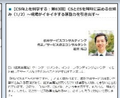
連載コラム「サービスを科学する」