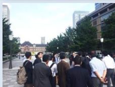
三菱地所 東京・丸の内エリアの視察