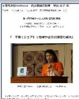
ベストプラクティス事例紹介