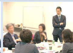
SPRING Café 「CSを語ろう」