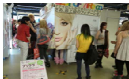
プリクラ体験コーナー