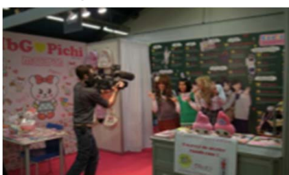
ピチレモン制服試着コーナー