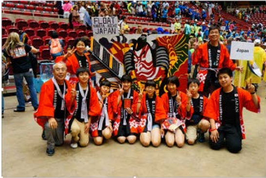
・ODYSSEY OF THE MIND 2016 WORD FINALS 4位入賞 ・フロートパレード 入賞 (2016年5月 アメリカ アイオワ州立大学)