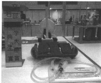
<あいち少年少女創意工夫展 2015 文部科学大臣賞受賞 「車球タイヤカー」>