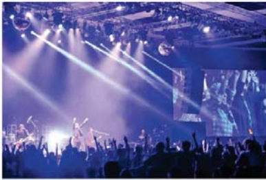
東京スカパラダイスオーケストラ JAPAN NIGHT in Jakarta 2015年4月4日

・ アニメなど過去の 映像作品のアーカイブを整備し、 訪問者が自由に閲覧できる 拠点を構築 (竹芝地区の国家戦略特区を活用)