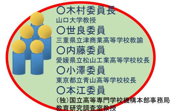
③高等学校（普通・専門）・ 高等専門学校WG

○昨年度は、学校関係者を中心に①小学校WG、②中学校WGの2つを立ち上げ、小中学校における「知財創造教育」の体系化を行った。