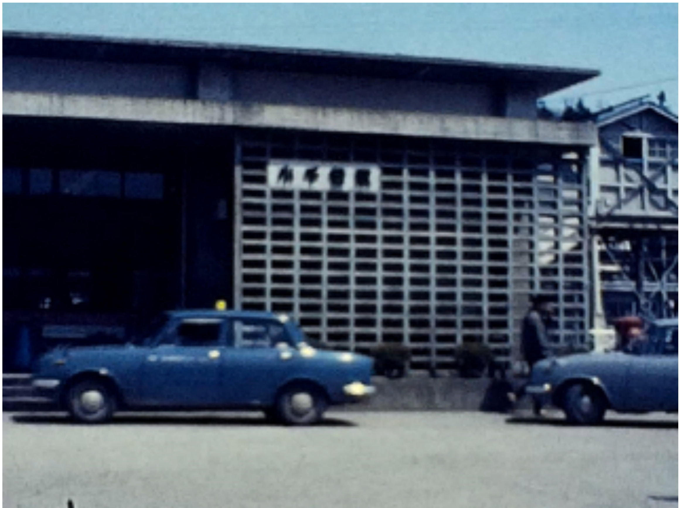
新潟県 小千谷駅前