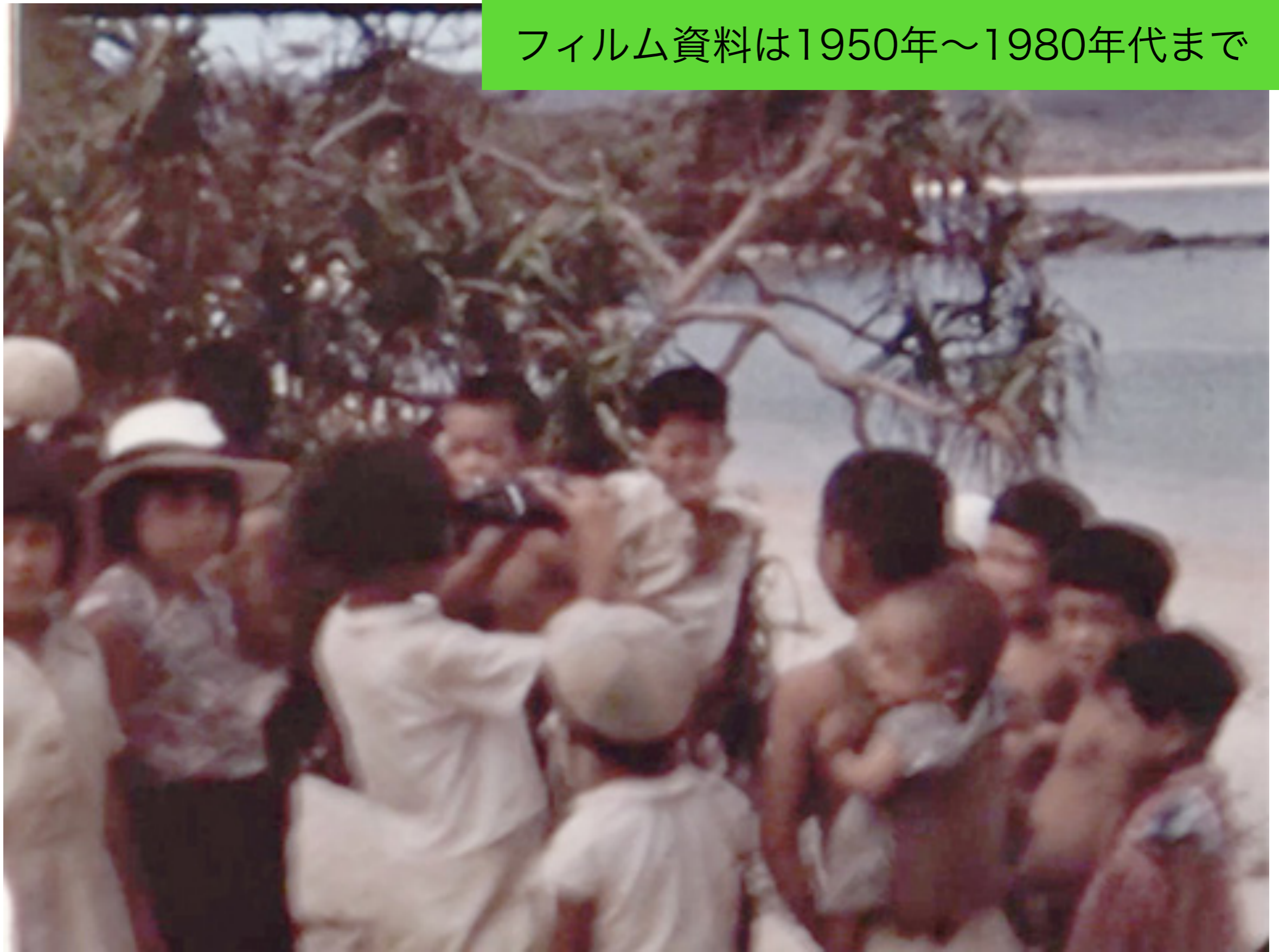
1955年ごろ 沖縄県北部の子供