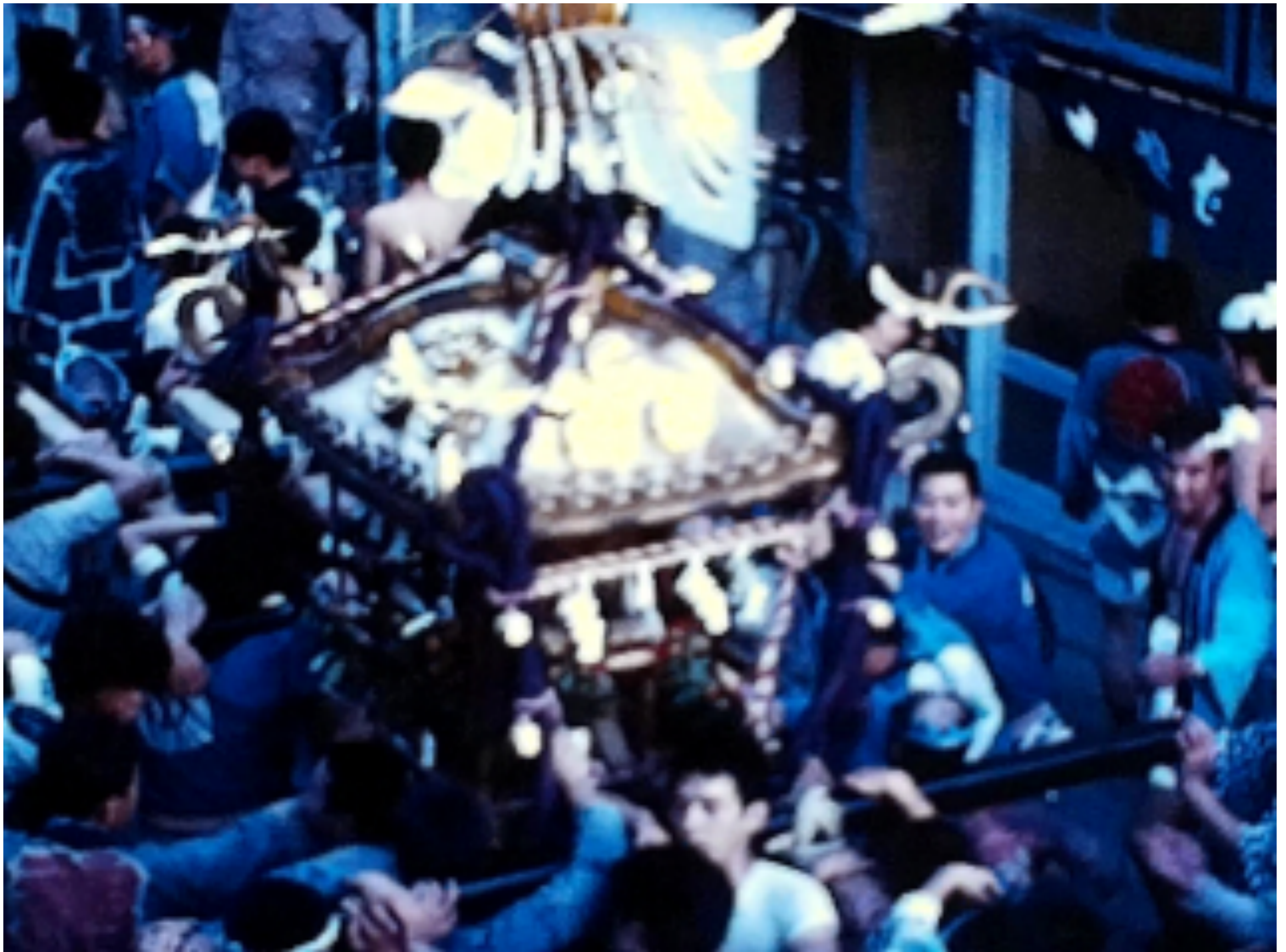
羽田まつりの記録