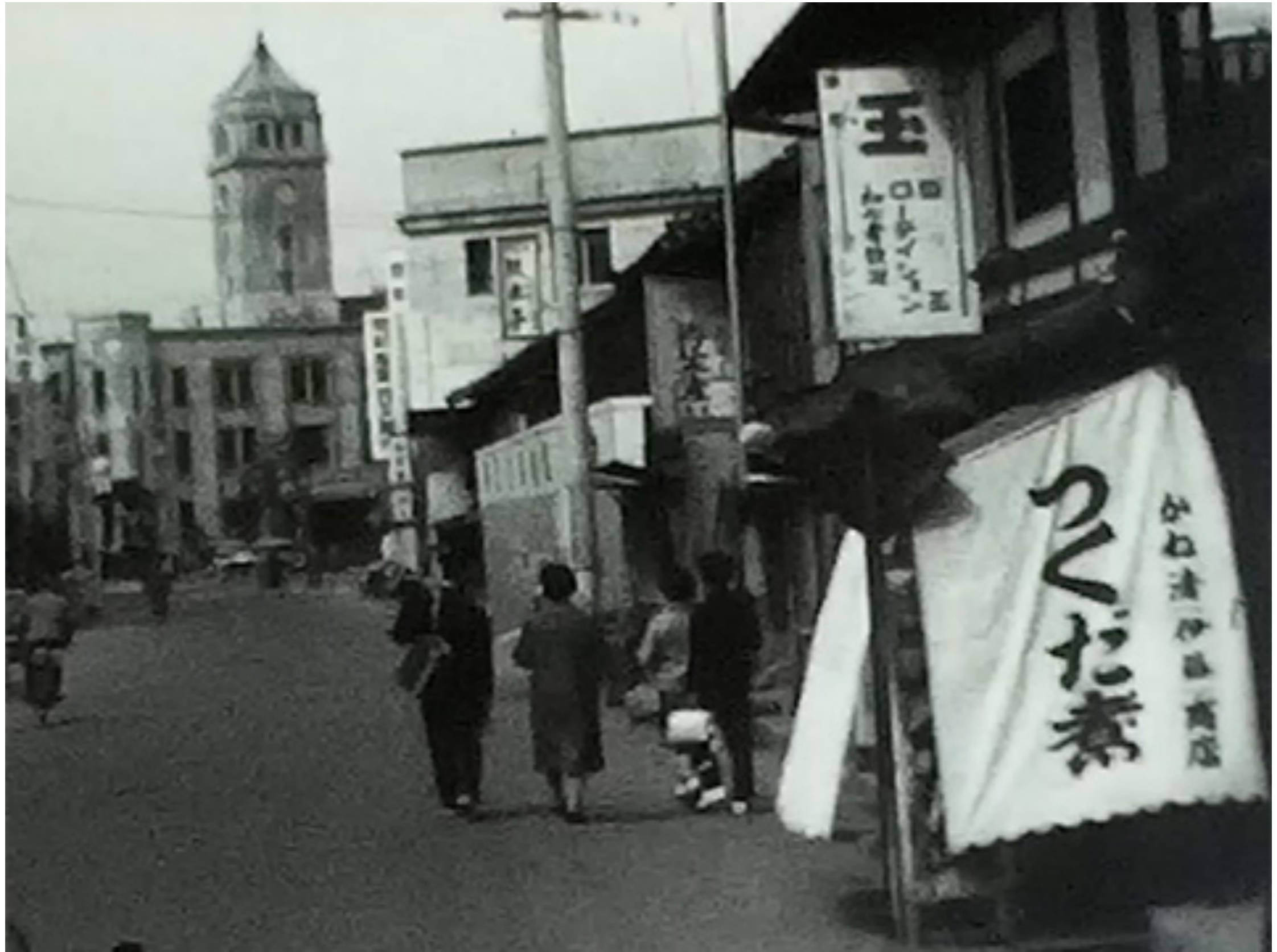
滋賀県 大津市役所 旧庁舎