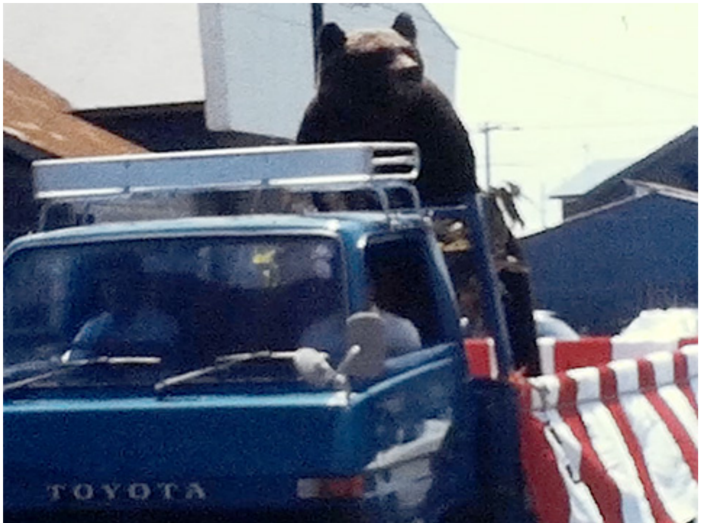
北海道苫前町 開基百年祭