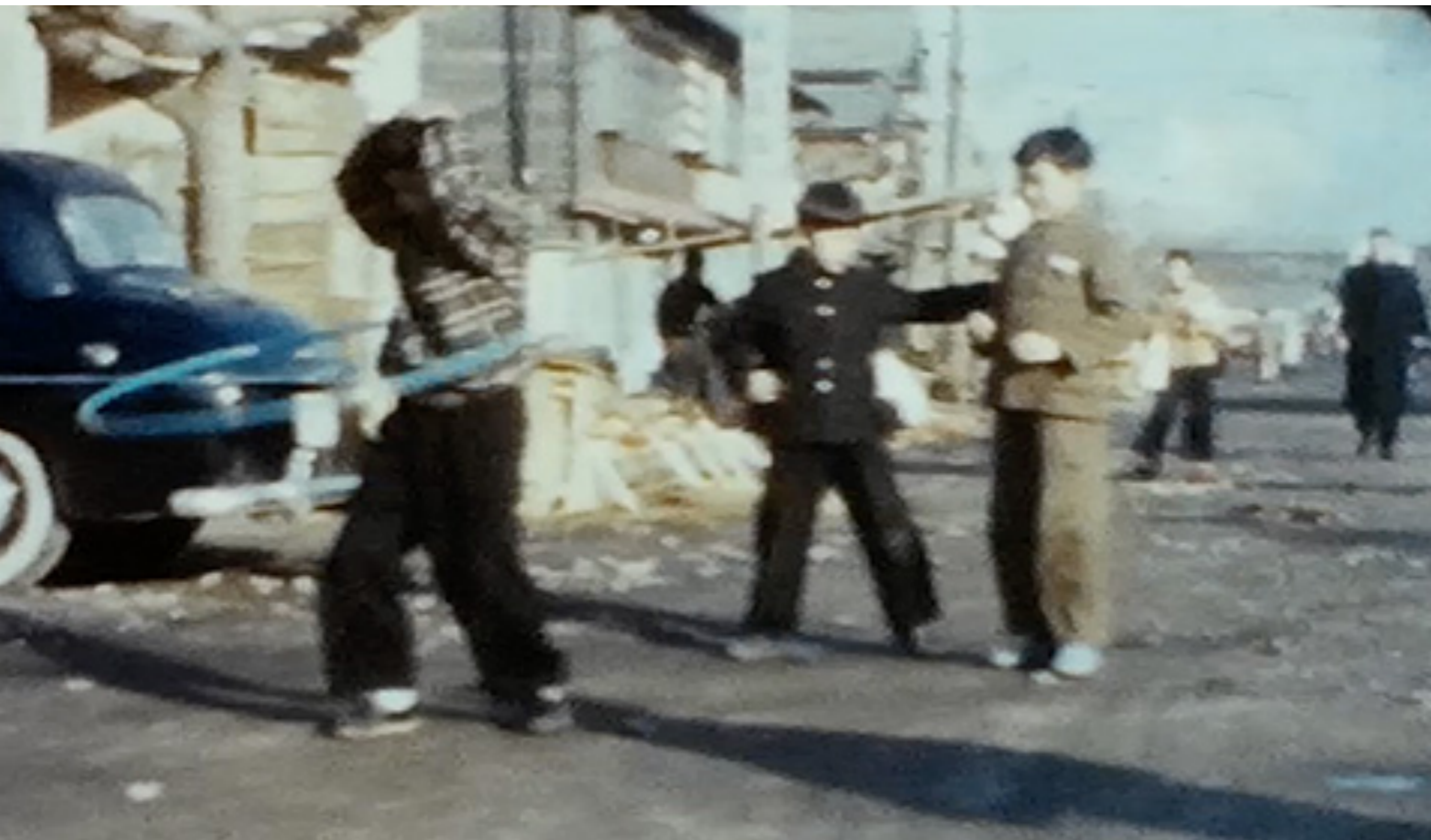
新潟県新潟市東区 林医院前