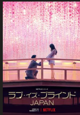
リアリティー 番組