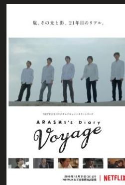
ドキュメンタリー