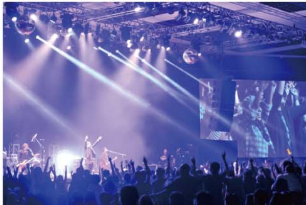
東京スカパラダイスオーケストラ JAPAN NIGHT in Jakarta @ The Kasablanka 2015年4月4日

・アニメなど過去の 映像作品のアーカイブを整備し、 訪問者が自由に閲覧できる 拠点を構築 (竹芝地区の国家戦略特区を活用)