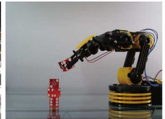
photo by Dan Ruscoe "Robotic Arm Lifting Dice" https://flic.kr/p/deHTEb