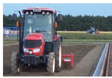
試験用のほ場やロボット農機