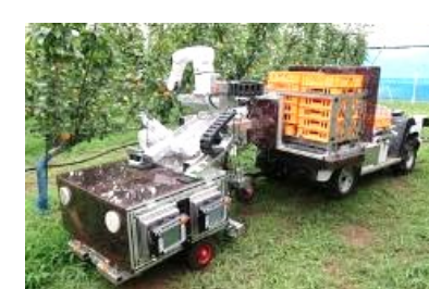
スマート農業技術の活用 （自動収穫ロボット）