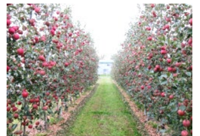
生産方式の見直し （機械作業が容易な樹形への転換）