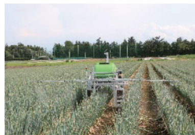
スマート農業技術の研究開発に取り組むスタートアップ企業