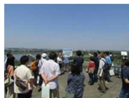
荒川第一調節池見学会(彩湖自然学習センター)