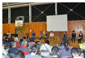
学校の森・子どもサミット（林野庁）