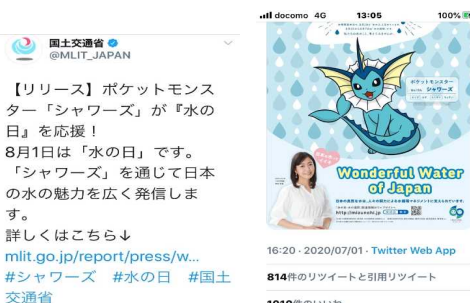
令和2年7月1日付 国交省公式Twitter