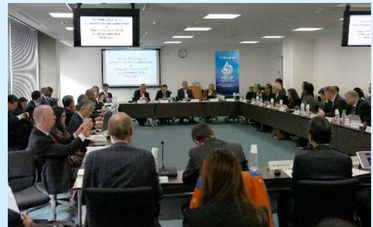
水と災害ハイレベルパネルの様子