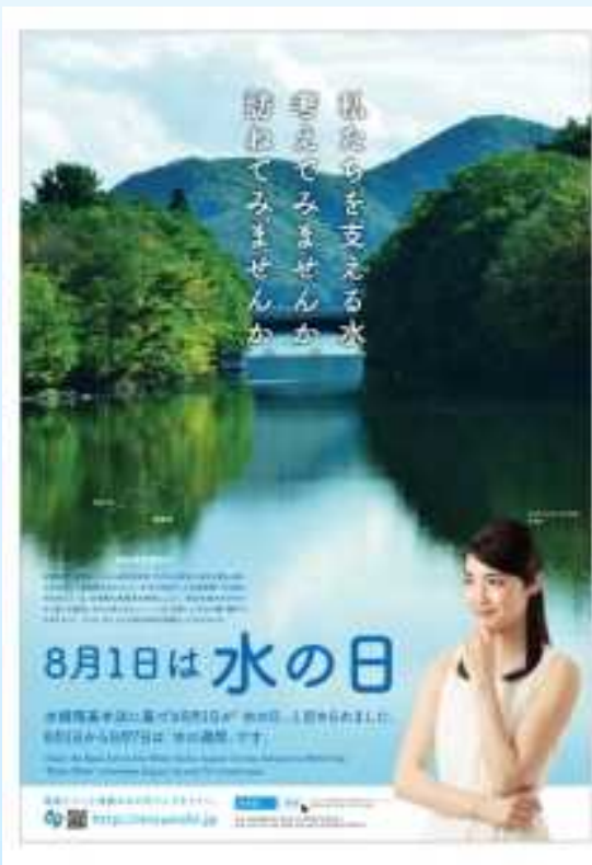
令和元年「水の日」ポスター