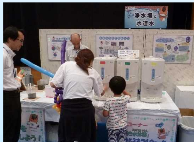
利き水体験の様子(ぐんまウォーターフェア)