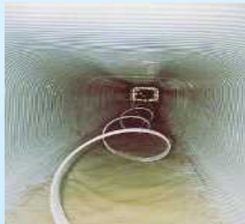
更生工法による長寿命化(下水道)