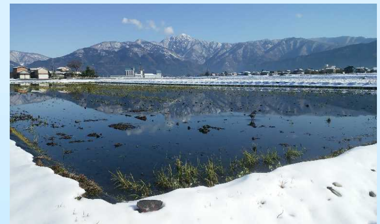
水田湛水(福井県大野市)