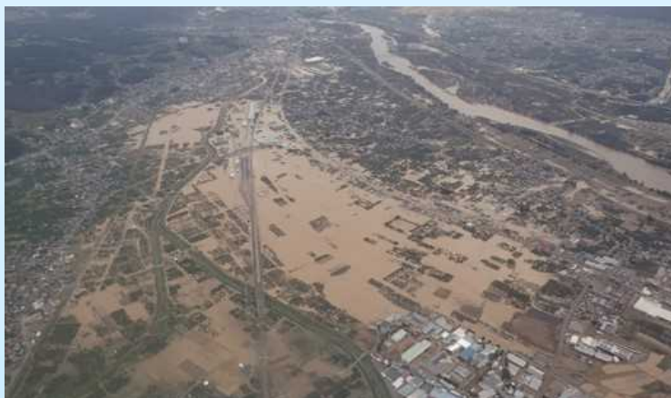
令和元年東日本台風による被害(千曲川)