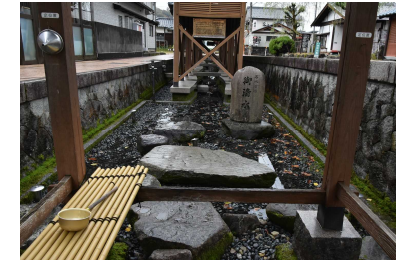
湧水の干上がり 出典) 大野市

広域的な地盤沈下や地下水の枯渇等は沈静化してきたものの、依然として、過剰な地下水利用や地下水汚染など地下水に係る課題は発生