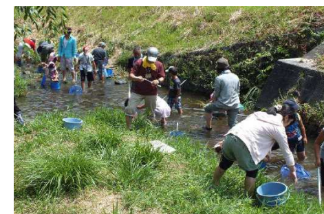
市民による水質一斉調査