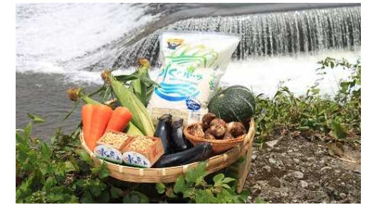
地下水を育む農産物のブランド化