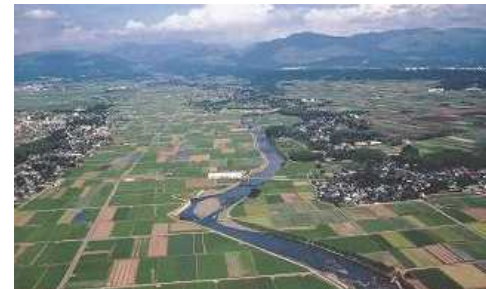
白川中流域の水田湛水事業