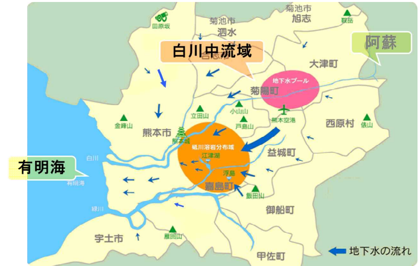
地下水盆を共有する熊本地域