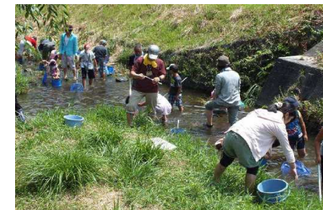
市民による水質一斉調査