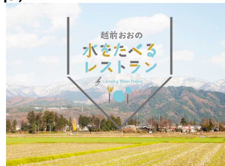
水文化のブランド化活動