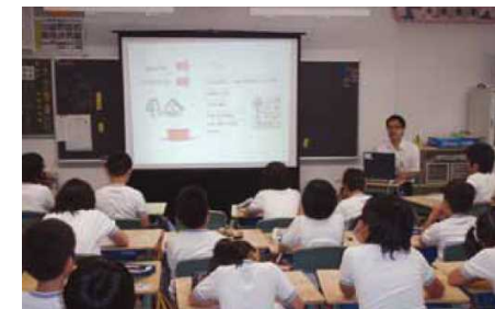
水に関する学習会