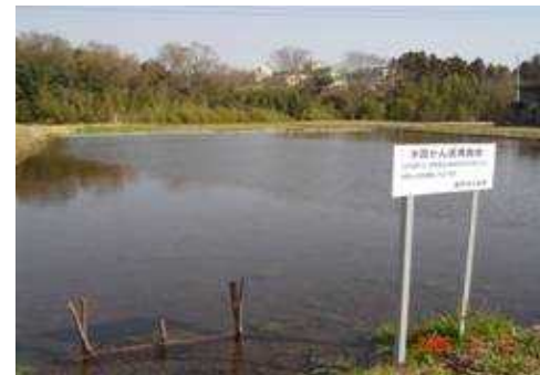
東田原地区における水田かん養