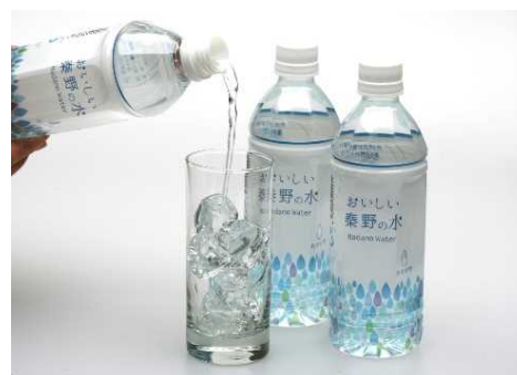
おいしい秦野の水・丹沢の雫