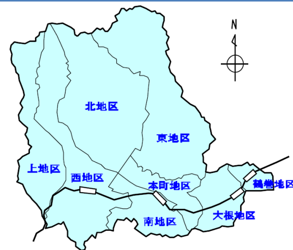
流域マネジメント対象地域 (秦野市域)