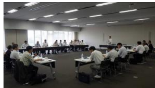
安曇野市水資源対策協議会の様子