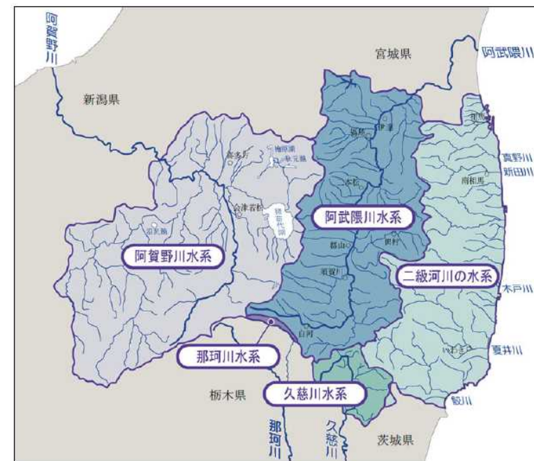
流域マネジメント対象地域 (福島県全体)