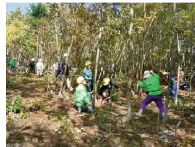
県民参画の森作り