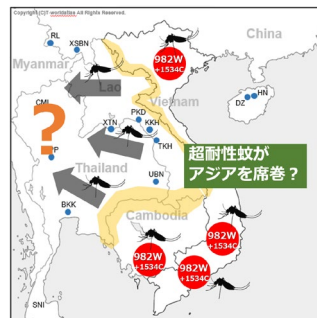
【左地図】 インドシナ半島における殺虫剤超耐性遺伝子保有ネッタイシマカの分布