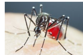
【下写真】 殺虫剤の超耐性が問題になっているネッタイシマカ