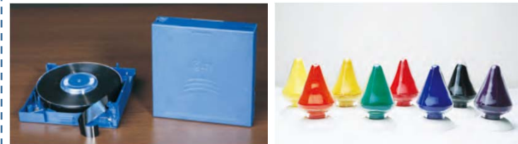
コンピュータデジタル記録テープ