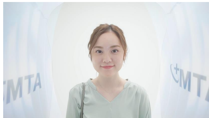
包み込むようなプライバシー空間