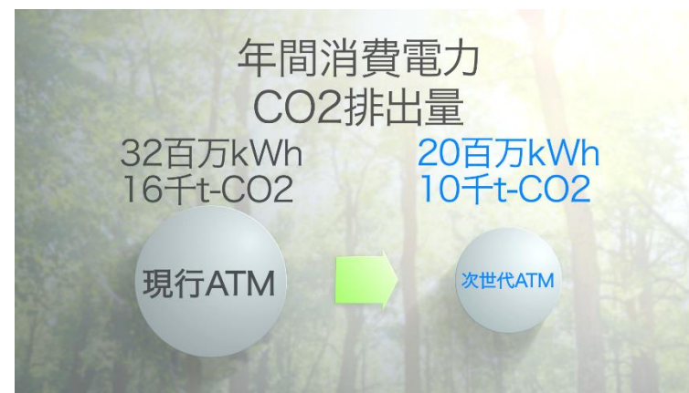
ATM停止 50%削減 消費電力 40%削減