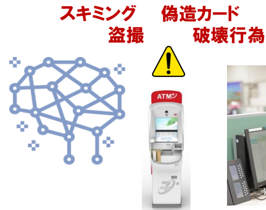
A.I + モニタリング体制 徹底した防犯対策