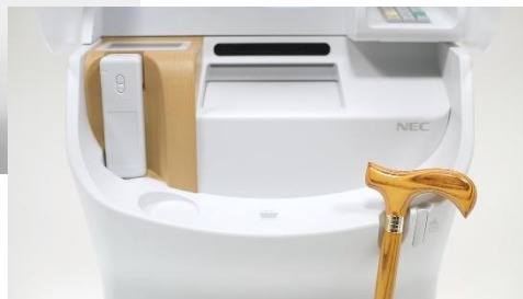
ユニバーサルデザイン追求