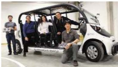
Polaris GEM e4 and e6