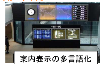
案内表示の多言語化