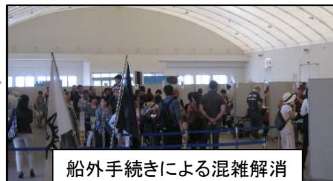
船外手続きによる混雑解消