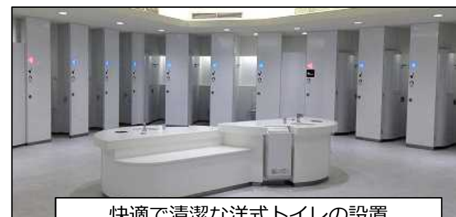
快適で清潔な洋式トイレの設置

・外国人が出入国に利用するターミナルや外国人が国内移動に利用する 全111ターミナル において、 2018年度中 にトイレの洋式化を 100% とするとともに、洋式トイレの新增設や既設の洋式トイレの高機能化を進める。