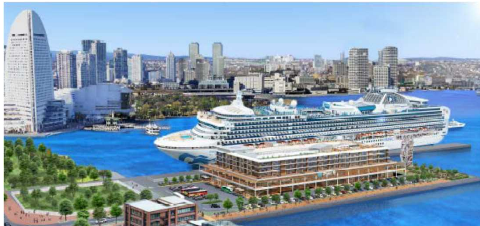
旅客ターミナルビルの整備(イメージ)