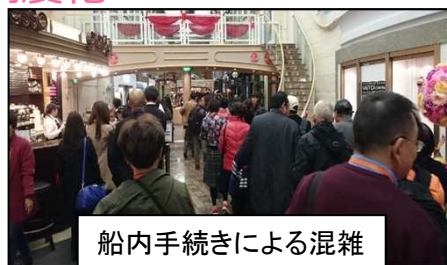
船内手続きによる混雑