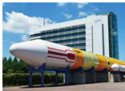
H-II ロケット実機展示