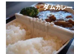
地元による特産品開発が多数