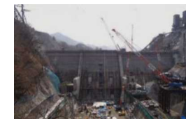
日々変化する工事現場