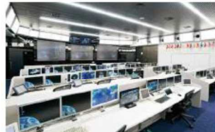
「きぼう」運用管制室