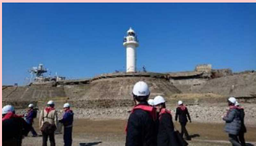
旅行会社等と現場見学会 (2018. 3)