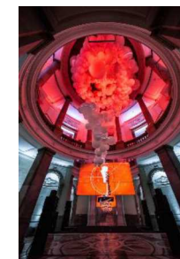
ユニークベニューとしての活用