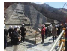
コンシェルジュによる現場見学