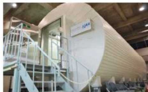
宇宙飛行士訓練施設