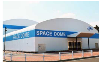
展示館「スペースドーム」

※年間来場者数は28万人(平成28年度) ※「きぼう」運用管制室、宇宙飛行士訓練施設等、料金500円