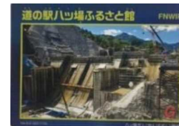
「ダムカード」が人気