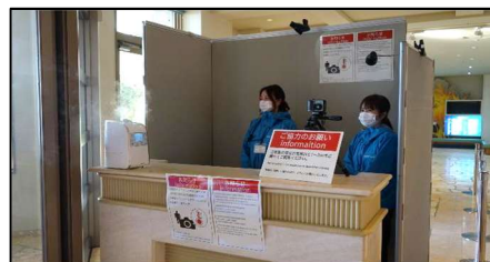
サーモグラフィーによるモニタリング