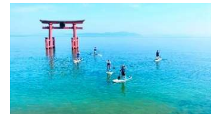
地域の観光資源の魅力の発信