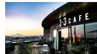
公共施設への カフェ等の併設

公共施設(国立公園内の施設、文化施設等)へ民間のノウハウ導入を促進すべく、 民間活力を導入する場合の施設改修を支援 し、これらの施設の魅力と収益力を向上。