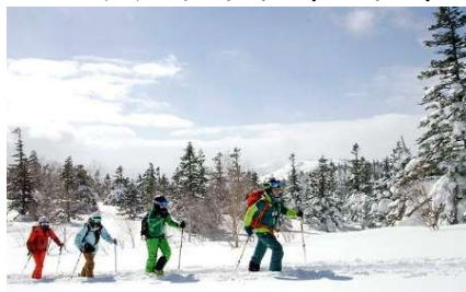
スノーシュートレッキング