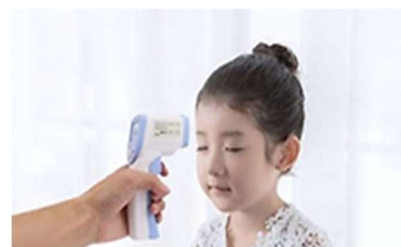
非接触体温計の導入