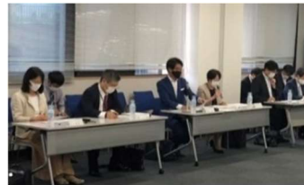
R2.10月開催の第1回委員会の様子