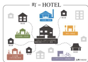
小規模宿泊事業者の協業 (分散型ホテル)

宿の事業承継や統合、複数宿が一つのホテルとして運営する取組や、 飲食施設の共有といった複数の宿等が連携した取組、他の事業者と連携した新たなビジネス創出 を支援し、宿の魅力と収益力を向上。