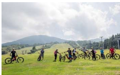
eBikeを活用したグリーンシーズンアクティビティ