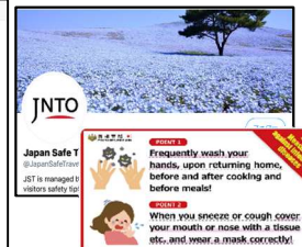
安全・安心情報の発信