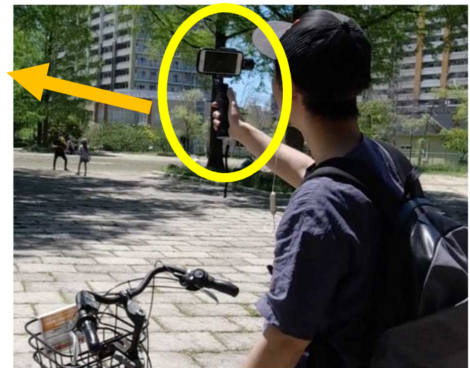
オンラインツアーの様子