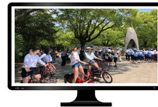
ツアー参加者の画面