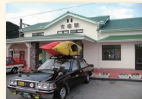
カヤックタクシー