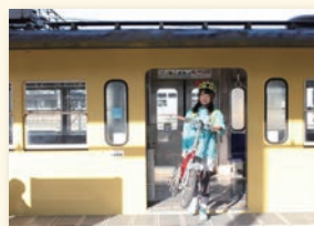
サイクルトレイン