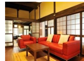
多様なニーズへの対応