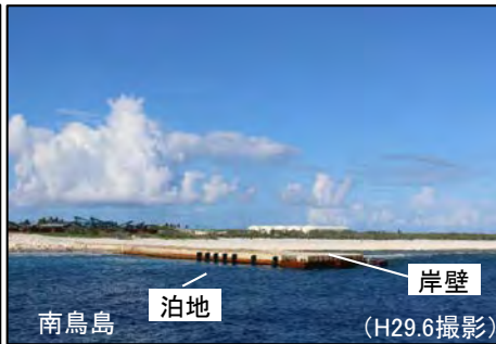
南鳥島及び沖ノ鳥島における特定離島港湾施設の整備状況