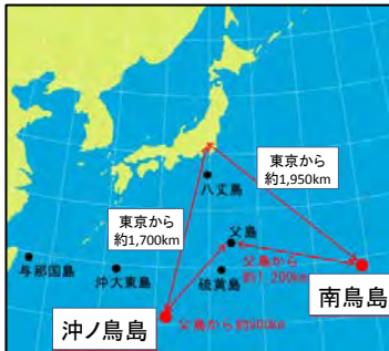
南鳥島及び沖ノ鳥島の位置図