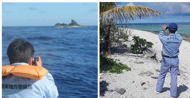
低潮線保全区域の巡視状況