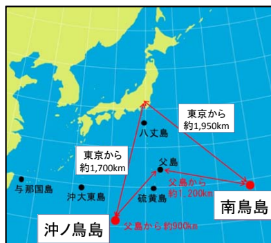
南鳥島及び沖ノ鳥島の位置図