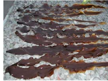
利尻昆布(利尻・礼文)