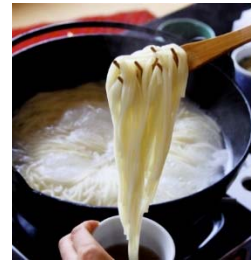
五島うどん(五島列島)