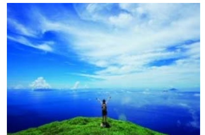
御岳からの風景(吐噶喇列島)