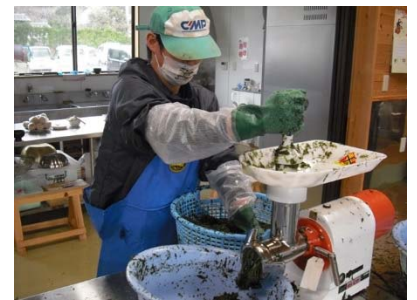
海藻加工の作業風景(隠岐諸島)