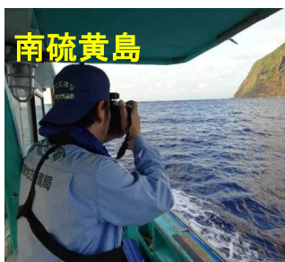
船上からの確認状況