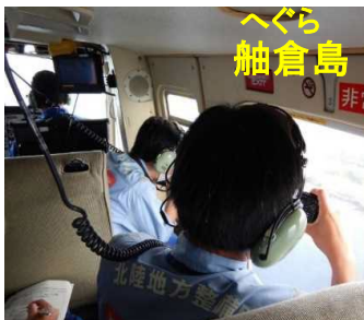
飛行機からの確認状況