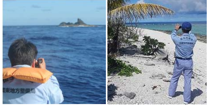
低潮線保全区域の巡視状況